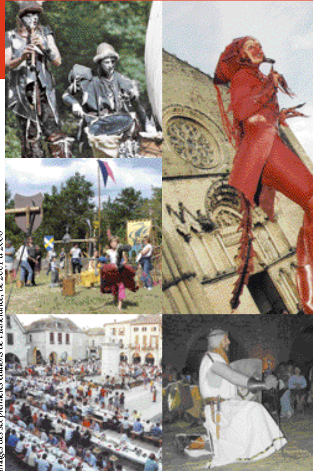
Images des six premières éditions de l'itinérance, de 2001 à 2006